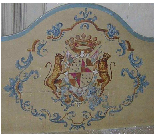
Particolare Stemma Asinari Piossasco de Rossi di None Consignori di VIRLE. Castello di Virle.